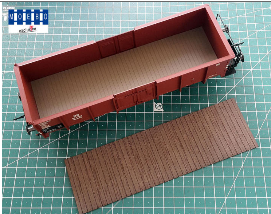
0- 142985 Ladeboden in Echtholzoptik f. Schnellenkamp omm55 / E40