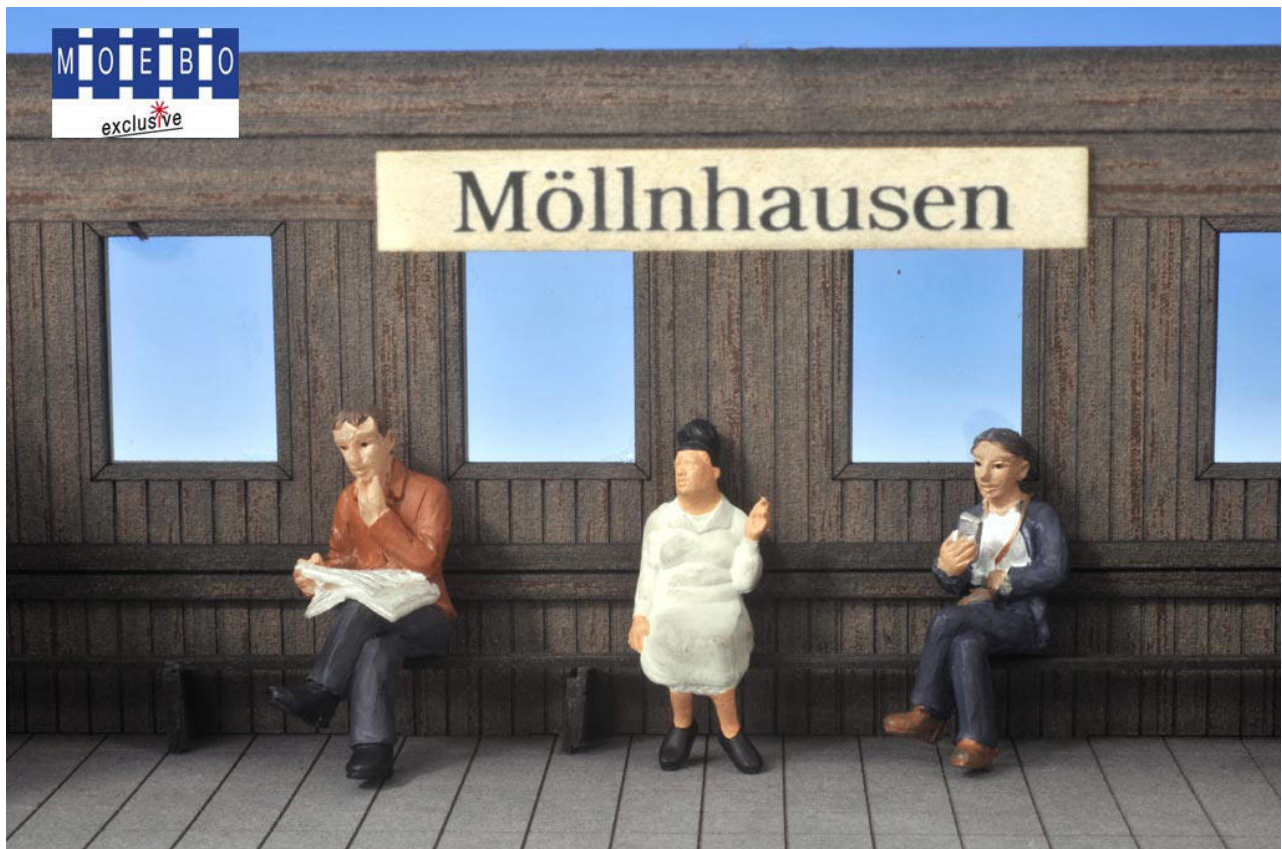
Filigrane maßstäbliche Holzgravur , mit vorbildlichen Holzbänken